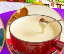
ฟองดูชีส