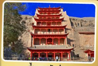
ถ้ำแกะสลักม่อเกา