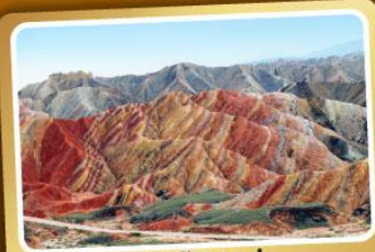
เวาสายรุ้งจางเย่