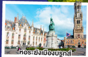
หอระฆังเมืองบรูจส์