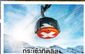
กระเช้ากิตลัส

ฝรั่งเศส เบลเยียม เนเธอร์แลนด์ 10วัน ลักเซมเบิร์ก สวิตเซอร์แลนด์ 7คืน