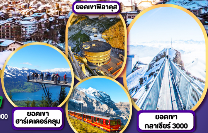
ยอดเขาพลาตุส