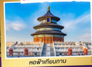
หอฟ้าเทียนถาน

จ่ายราคาเดียว... เที่ยวครบ..ไม่จ่ายเพิ่ม