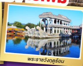
พระราชวังฤดูร้อน

เที่ยวเต็มอิ่ม ไม่ลงร้านช้อปปิ้ง พักดี 4 ดาว ★★★★★