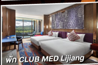
พัก CLUB MED Lijiang