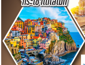
หมู่บ้านมานาโรลา