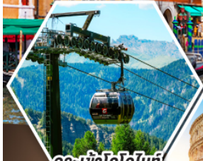
กระเช้าโดโลไมท์