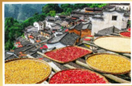
เมืองกระซำซันหมู่บ้านหวงหลิง