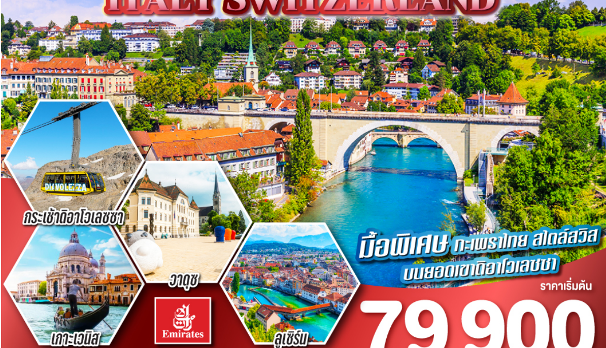
กระเช้าดิวาโวลูซซา