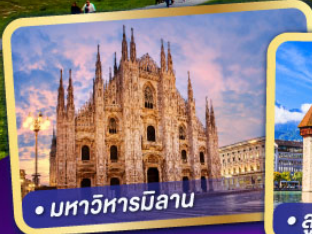
• มหาวิหารมิลาน

สวิตซ์ พิชิต 3 TOP 8 วัน 5 คืน เพียต - จุงเฟรา - ฮาร์เดอร์ คุล์ม