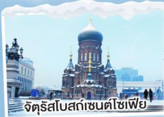
จัตุรัสโบสถ์เซนต์โซเฟีย