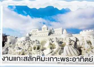
งานแกะสลักหิมะเกาะพระอาทิตย์

งานเทศกาล HARBIN ICE &amp; SNOW FESTIVAL