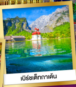
เบิร์ชเต็กกาเดิน