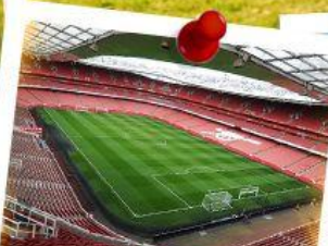
Old Trafford Stadium