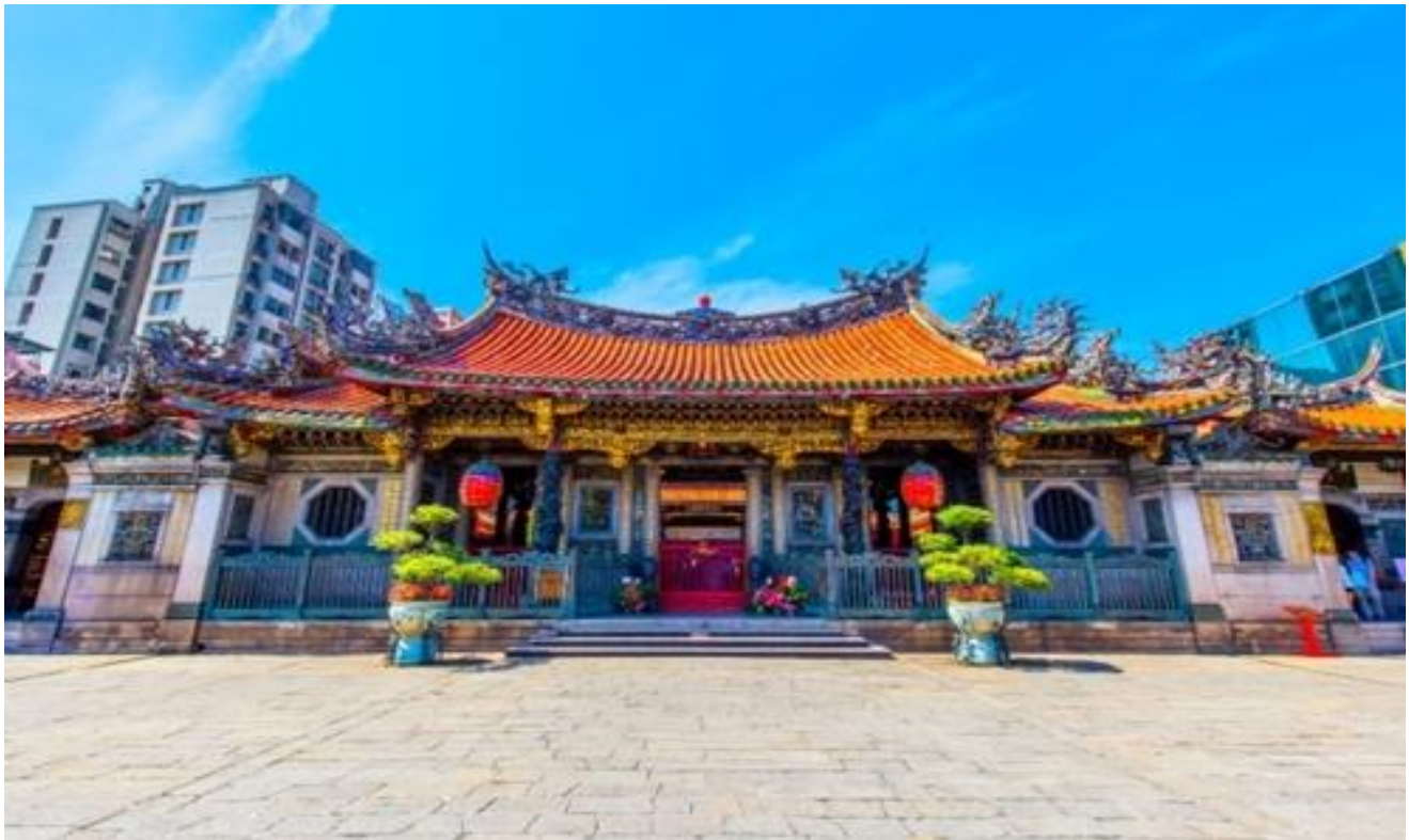
อิสระรับประทานอาหารกลางวัน

ได้เวลาอันสมควรนำท่านเดินทางสู่สนามบินเถาหยวน