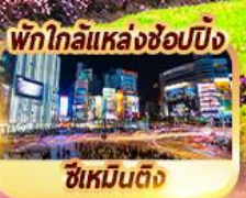
พักใกล้แหล่งช้อปปิ้ง