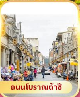
ถนนโบราณต้าชิ