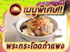
เมนูพิเศษ!! พระกระโดดกำแพง