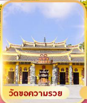
วัดขอความรอย