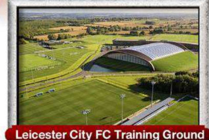
Leicester City FC Training Ground

พิเศษ!! เมนู เบอร์เกอร์ต้นตำรับ & กุ้งลือบสเตอร์ และ เปิดย่างไฟร์ชิลีน