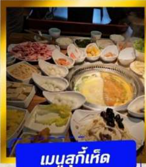
เมนูสุกี้เด็ด