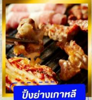
ปิ้งย่างเกาหลี