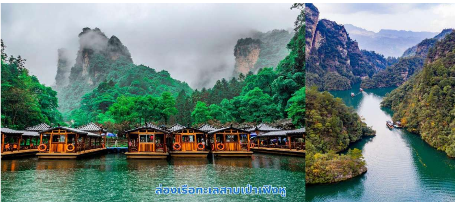
ล่องเรือทะเลสาบเป่าเฟิงหู

เช้า บริการอาหารเช้า ณ ห้องอาหารของโรงแรม นำท่านเพลิดเพลินไปกับการล่องเรือชมความงาม ทะเลสาบเป่าเฟิงหู (Baofeng Lake) ทะเลสาบที่สวยงาม ด้วยน้ำที่เป็นสีเขียวเข้มราวกับเนื้อหยกโอบล้อมด้วยภูเขาหินรูปทรงประหลาดแปลกตาต่าง ๆ มากมาย เป็นทะเลสาบบนที่สูง ที่หาชมได้ยาก ได้รับการขึ้นทะเบียนเป็นมรดกโลกทางธรรมชาติ ในปี ค.ศ. 1992