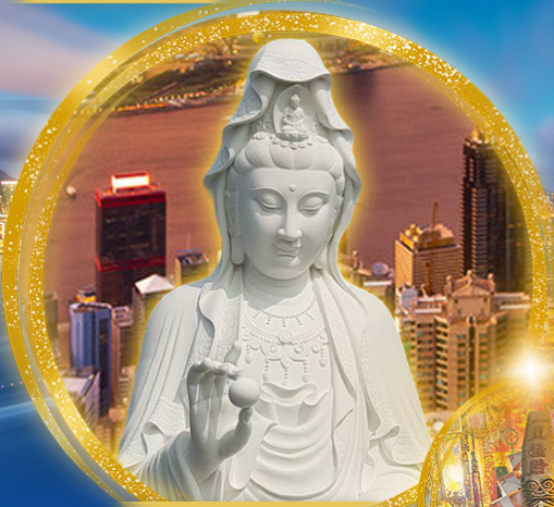
วัดซีซ่าน