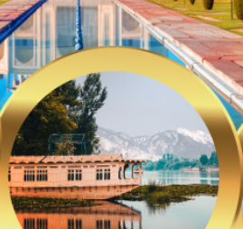
นอนบ้านเรือ วิวเวทิมาลัย