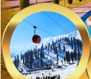
เคเบิลคาร์ กุลมาร์ค