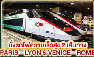
นั่งรถไฟความเร็วสูง 2 เส้นทาง PARIS - LYON & VENICE - ROME

เดินทาง : 11-20 ก.พ. 68 | 15-24 มี.ค. 68