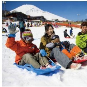
ลานสกีเยติ