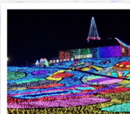
งานประดับไฟหมู่บ้านเยอรมัน