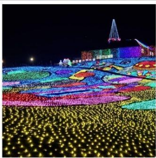
งานประดับไฟหมู่บ้านเยอรมัน