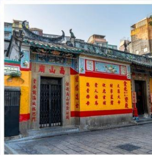
วัดเปากง