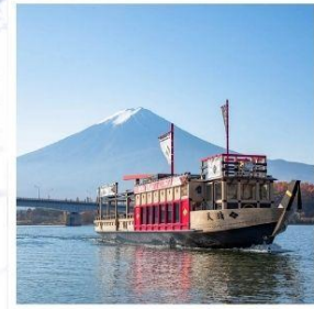
ล่องเรืออัปปะระะ