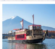
ล่องเรืออัมปะระ