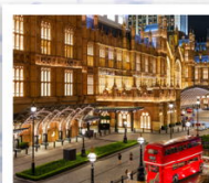
เดอะ คอนดอนเนอร์