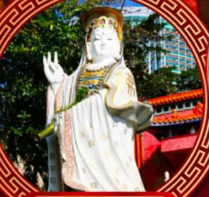
เจ้าแม่กวนอิม ริพลัสเบย์