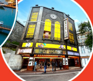
ร้าน POP MART ใหญ่ที่สุดในไต้หวัน