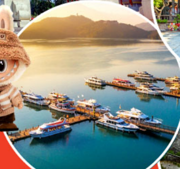
ทะเลสาบสุริยขึ้นจันทรา