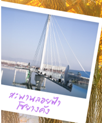
สะพานลอยฟ้า โซยางคัง