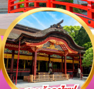
ศาลเจ้าคาโซฟู