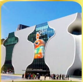
โรงละครแห่งชาติไทจง