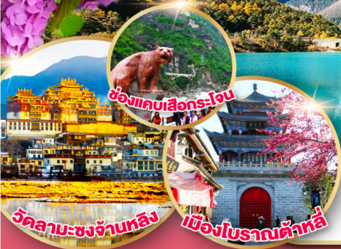
ช่องแคบเสีอกระโจน