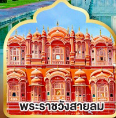
พระราชวังสายลม