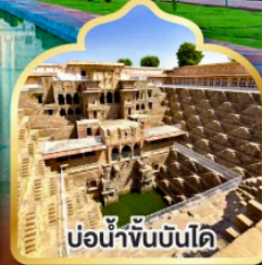
บ่อน้ำพันบันได