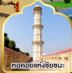
หอคอยแห่งชัยชนะ