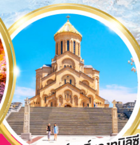
วิหารศักดิ์สิทธิ์ของทบิลีซี