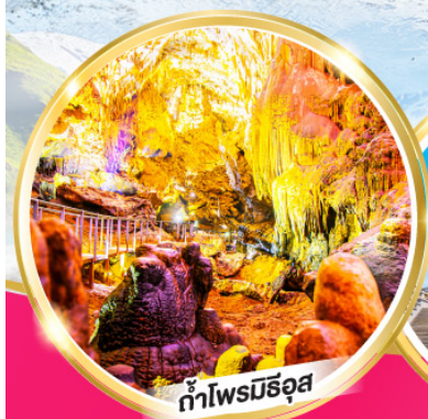
น้ำไฟรมีริอุส