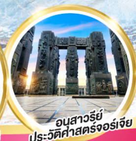
อนุสาวรีย์ ประวัติศาสตร์จอร์เจีย