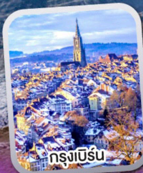
กรุงเบิร์น