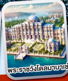
พระราชวังโดลมาบาเย