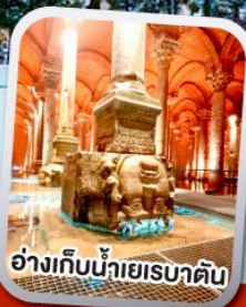
อ่างเก็บน้ำเยเรบาดัน