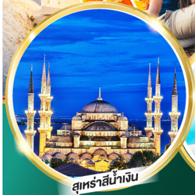
สุเหร่าสีน้ำเงิน