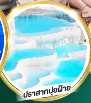
ปราสาทปูนฝ้าย