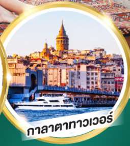
กาลาตากาวเวอร์