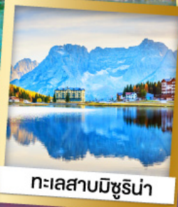
ทะเลสาบมิชูรีน่า