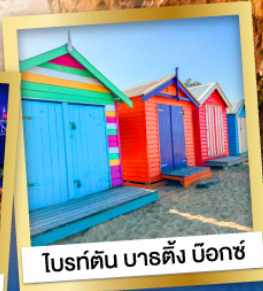
โบรเก้ตัน บาร์ดิง บ็อกซ์