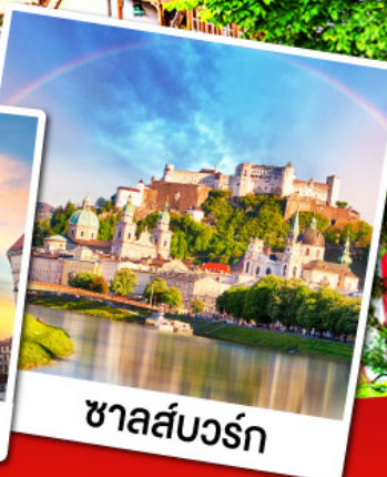
ชาลส์บวร์ก