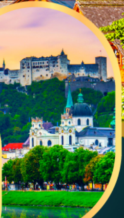
ซาลซ์บูร์ก