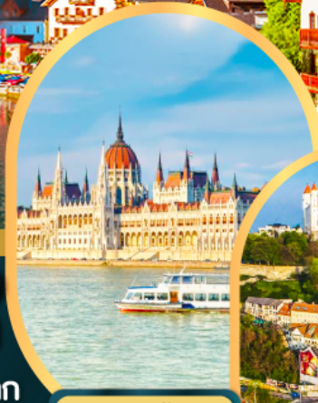
ล่องเรือแม่น้ำดานูบ