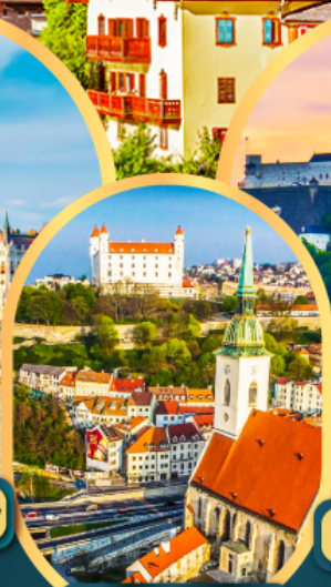
บราติสลาวา