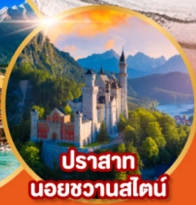
ปราสาท นอยชวานสไตน์