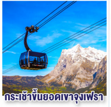
กระเช้าขึ้นยอดเขาจุงเฟรา

เดินทาง 10- 16 มี.ค. 68 / 03-09 พ.ค. 68 10-16 มี.ย. 68