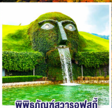
พิพิธภัณฑ์สวารอฟสกี

เข้าชมความงดงามของปราสาทนอยชวานสไตน์ “1 ในปราสาทที่สวยงามที่สุดในโลก”