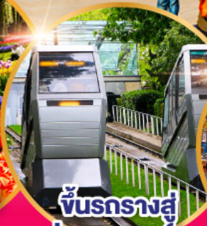
ชั้นรางสู่ ย่านมงมาร์ต